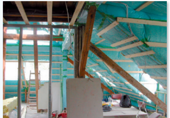
Vazдушna barijera je još uvek vidljiva: Ovo je optimalni trenutak za BlowerDoor merenje.

merenja, automatizovani BlowerDoor postupak sprovodi se u skladu sa evropskim standardom EN 13829. Preko BlowerDoor ventilatora, vazduh se konstantno izbacuje iz zgrade, tako da se unutar nje stvara negativni pritisak od 50 Pa. Korisnici mogu boraviti u objektu za vreme merenja i za to vreme neće doživeti nikakvu neugodnost. Ako postoji curenje na omotaču objekta, spoljni vazduh prodire u objekat preko spojeva i pukotina. Tokom obilaska, na zgradi se pažljivo proveravaju strujanja vazduha koja se lociraju pomoću anemometra ili IR termografije.