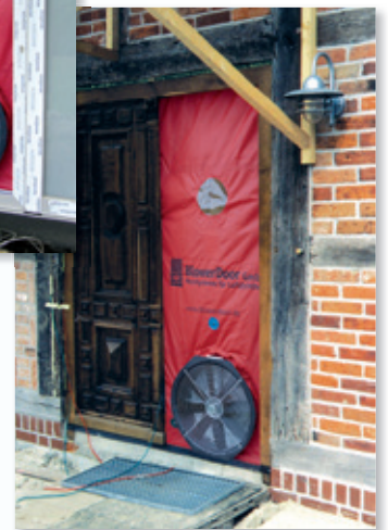
BlowerDoor merenje tokom rekonstrukcije objekta