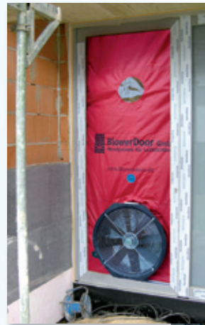
BlowerDoor test nove jednoporodične kuće

Zgrada se smatra zaptivenom kada se količina vazduha u objektu u uslovima testiranja ne razmenjuje više od tri puta na sat. Stoga "zaptiven" ne znači hermetički zatvoren objekat, već izbegavanje neželjenih curenja kroz omotač objekta. Ovo je veoma važno jer topao vazduh koji odlazi kroz spojeve predstavlja gubitak skupocene energije. U isto vreme, topao vazduh transportuje i vlagu koja se hladi na spoljnjem zidu zgrade i kondenzuje se. Ova kondenzacija može prouzrokovati ozbiljna strukturalna oštećenja. Spoljašnji vazduh koji prodire u zgradu preko spojeva transportuje alergene iz izolacije kao i čestice prašine unutar objekta, što može narušiti zdravlje njegovih korisnika.